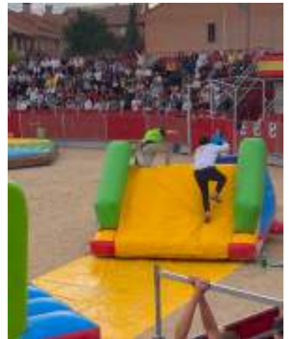
El Gran Prix y la Carrera Popular San Lucas fueron los platos fuertes de las prefiestas. Hubo una variada gama de torneos y actividades deportivas.