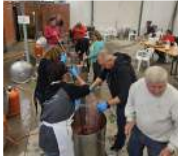
El alcalde con las tres pregoneras. Los chefs de la Caldereta. Las Peñas Ley Seka, Los charros y BBK animaron las fiestas.