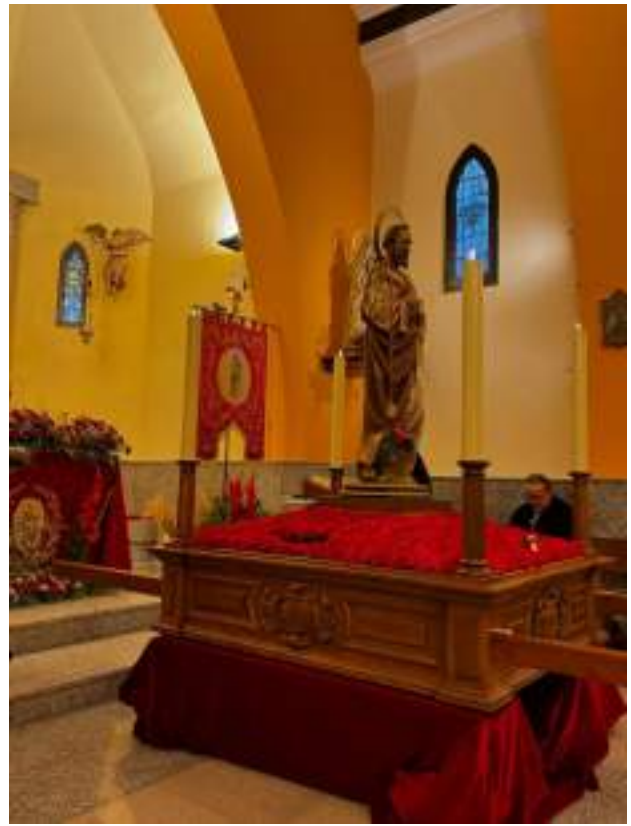
La imagen de San Lucas Evangelista tras la ofrenda floral. El santo fue trasladado al templo nuevo en la Procesión de la luz y regresó al templo antiguo al día siguiente, también en procesión.